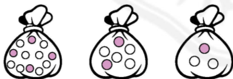
شکل (۱) شکل (۲) شکل (۳)

۱۰- در کدام کیسه احتمال بیرون آمدن مهره‌ی سفید بیشتر است؟